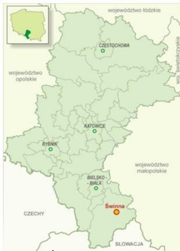
Ryc. 1. Lokalizacja Gminy Świnna na tle województwa śląskiego